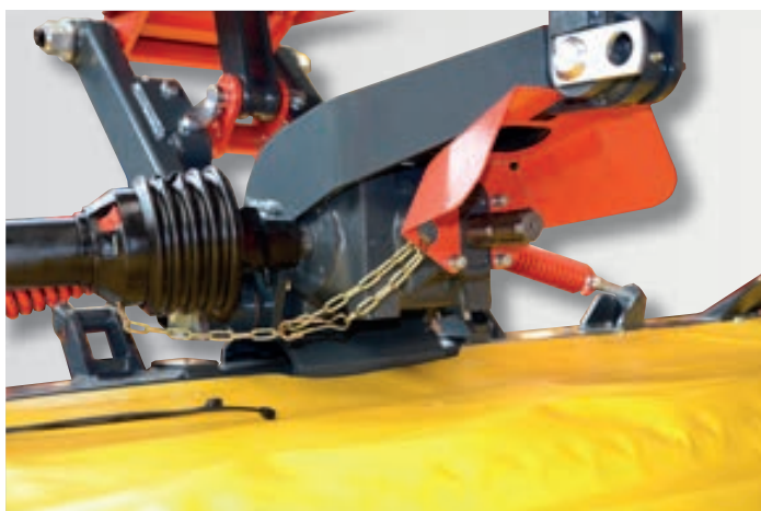
Vstupní převodovka , standardní nastavení z výroby je pro traktory s čelním náhonem s otáčením po směru hodinových ručiček, při pohledu na převodovku ve směru jízdy. Převodovku lze přestavit do jiné polohy.