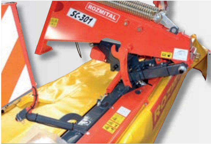
Odstavná poloha čelní sekačky.