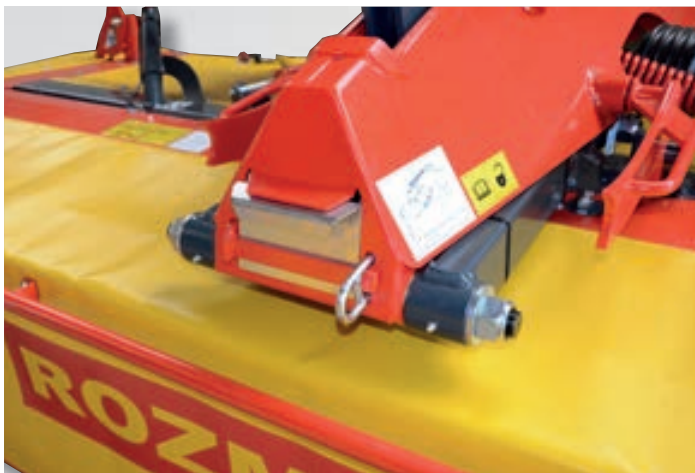
Páka na rychloupínání nožů a skladovací prostor pro náhradní nože.