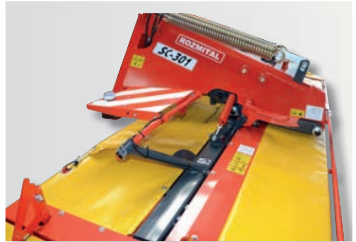
Transportní poloha čelní sekačky.