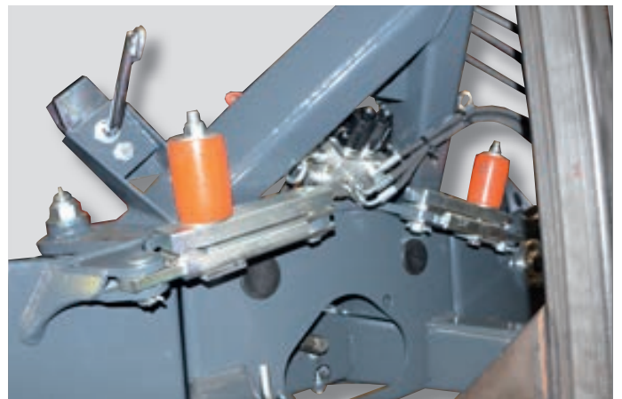
Elektrohydraulickým rozváděčem lze jednotlivě ovládat obě lišty z kabiny traktoru.