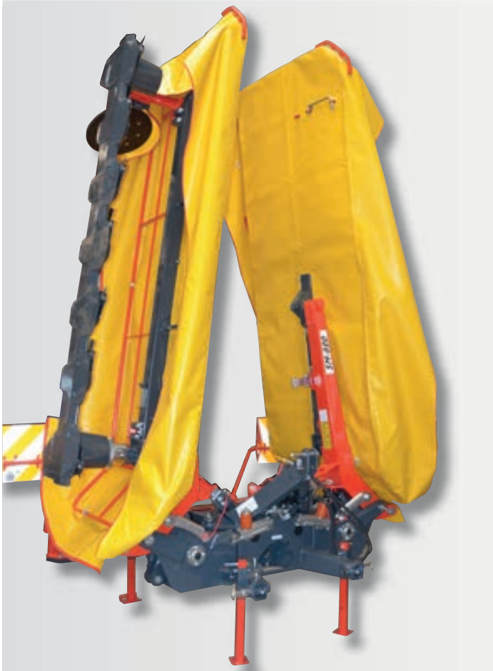
Čtyři opěrné nohy zajišťují bezpečné odstavení žací kombinace ve složeném stavu.