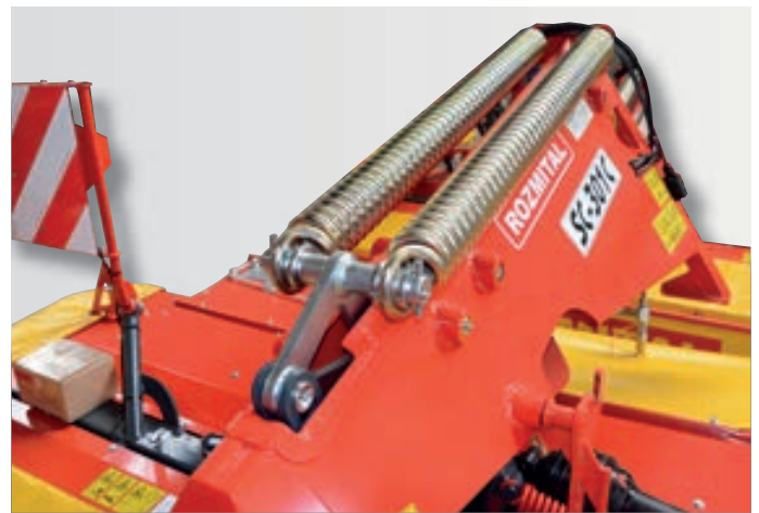
Nadlehčování lišty pomocí pružin.