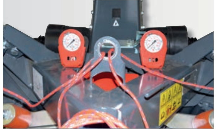
Hydropneumatické nadlehčování je součástí standardního vybavení.