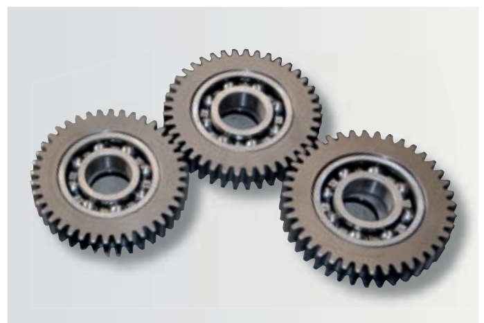
Ozubená kola lišty jsou vykovaná z ušlechtilé oceli a boky zubů jsou broušené. Šířka zubů je 22 mm u všech sekaček Rožmitál.