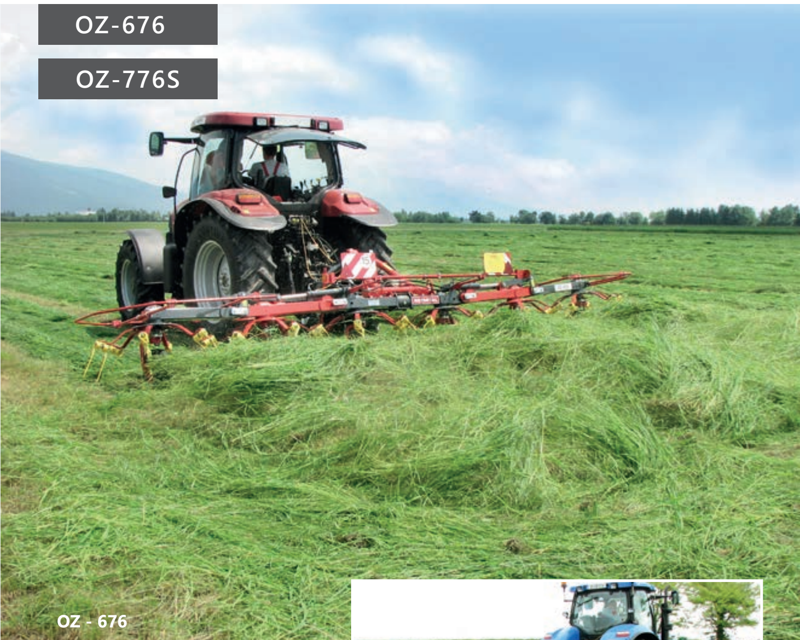
OZ - 676