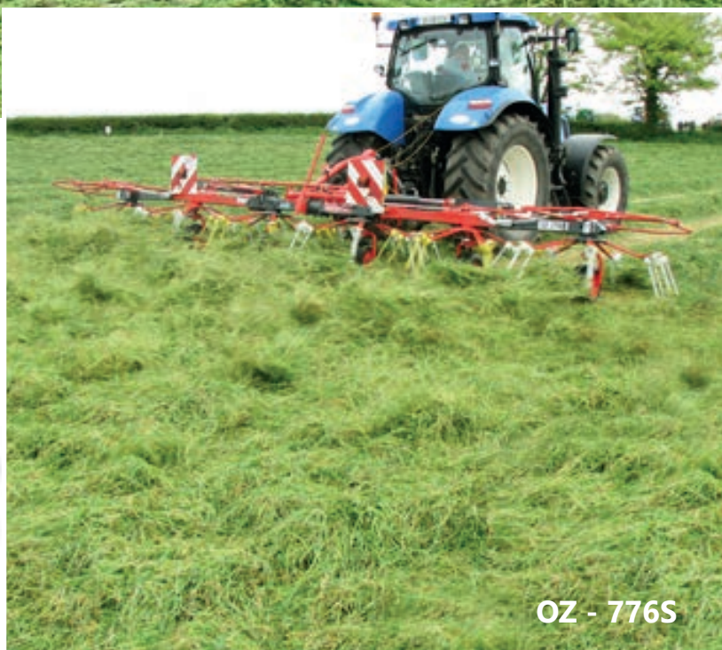
OZ - 776S